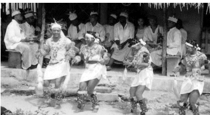
Groupe de danse traditionnelle «Efik»