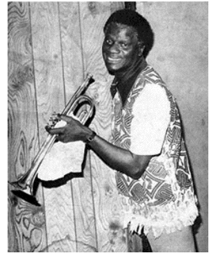
Victor Olaiya, le «Mauvais Génie» de HIGHLIFE