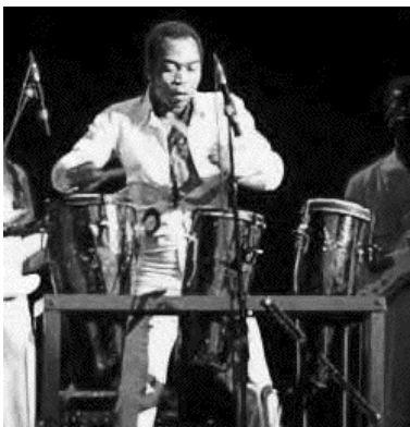
Fela aux «solo congas»

---extrait de http://www.musicweb.uk.net/