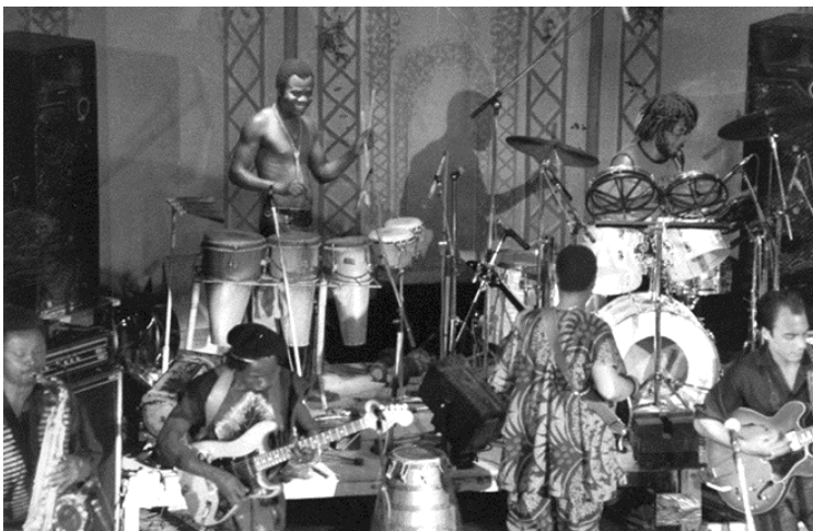
Ghetto Blaster sur scène – 1984

Il est remarquable qu'alors que tant d'Africains s'éloignent de leur culture lorsqu'ils quittent leur continent, Udoh maintienne son style de vie originel, fidèle à la cuisine africaine et au mode vestimentaire traditionnel. Ses instruments sont tous typiquement nigériens et reflètent son expérience dans toutes les régions du pays, y compris sa virtuosité sur le «talking drum», ce qui est rare pour un non-Yoruba.