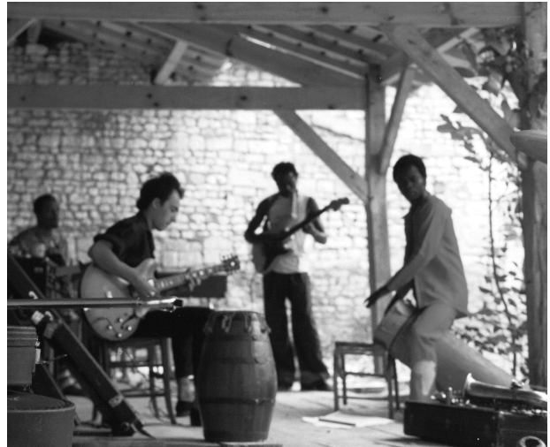
Ghetto Blaster en répétition, récemment arrivée en France